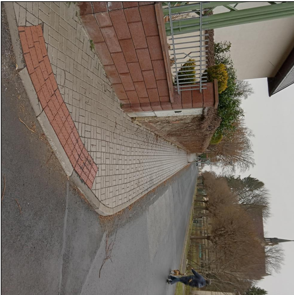
Nový chodník – ul. Kostelní

Již tradičně provádíme úpravu zeleně. Travní plochy jsou upravovány na základě smlouvy s městem Varnsdorf dle harmonogramu, který je odsouhlasen a kontrolován příslušným odborem (zde Odbor životního prostředí). Veškeré práce jsou přebírány městskými úředníky, čímž je zaručena nejen kontrola na více stranách, ale i kvalita odvedené práce.