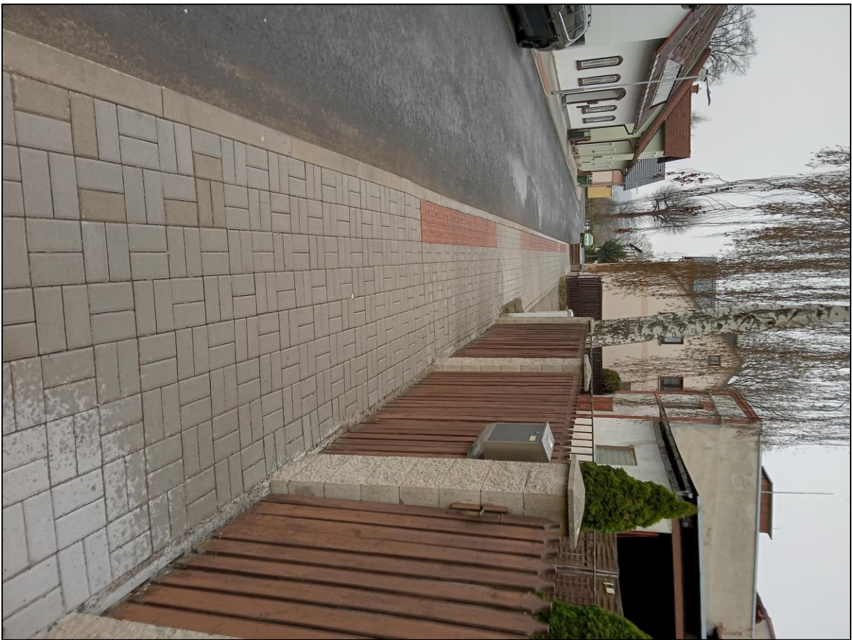
Nový chodník – ul. Šafaříkova

Podrobný přehled hospodaření je uveden v přílohách.