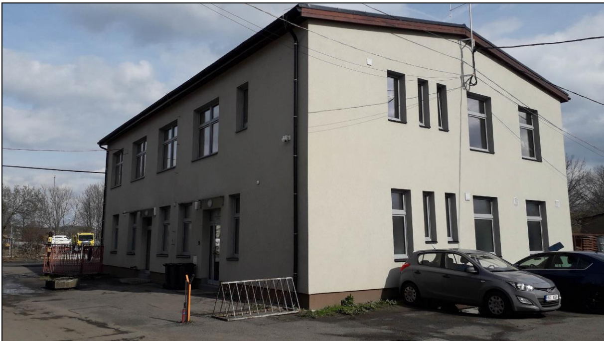
Zrekonstruovaná budova TS

(podrobné informace k jednotlivým předmětům podnikání jsou uvedeny v Živnostenském rejstříku)