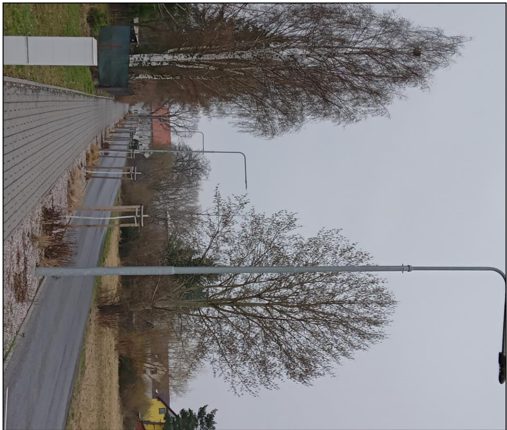
Veřejné osvětlení – ul. Žilinská/Náchodská

Pravidelně provádí vyškolená odpovědná osoba školení bezpečnosti práce stálých i nově příchozích zaměstnanců TS. Je kladen důraz na dodržování veškerých termínů pro preventivní prohlídky i proškolení, aby se zamezilo jakémukoli pochybení ze strany zaměstnavatele.