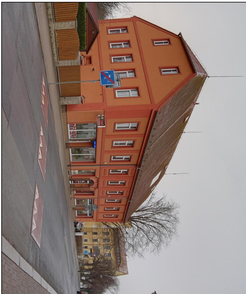
Zpomalovací poistare – ulice Národní

Včasným zajištěním strojové techniky, plošiny s podvozkem, Unimogu a pohřebního vozu se nám podařilo ušetřit 2,5 milionu Kč. Byli jsme upozorněni, že dodací doba bude delší, ale všechny tři položky byly objednány ještě za staré ceny. Také jsme nakoupili po dohodě s městem, větší množství kabeláže, kterou potřebujeme k rekonstrukci veřejného osvětlení ve Varnsdorfu a na Studánce, neboť ceny se neustále navyšují.