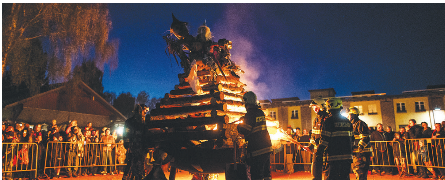
Varnsdorf upálil čarodějnice. Zima je tak oficiálně pryč

Varnsdorf ■ Také letos si Varnsdorf připomněl příchod jara tradičním pálením čarodějnic, které se konalo 30. dubna. Oblíbená městská akce tentokrát změnila své působiště. Kvůli probíhající rekonstrukci náměstí bylo nutné najít náhradní prostory. Po zvážení technických možností, jako je dostupnost elektrických přípojek či bezpečné zajištění ohňostroje, padla volba na areál pivovaru Kocour.