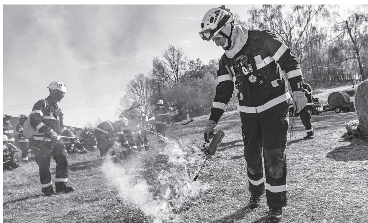
Dobrovolná jednotka se zúčastnila výcviku hašení lesních požárů

Program byl zaměřen především na práci v náročných pod-