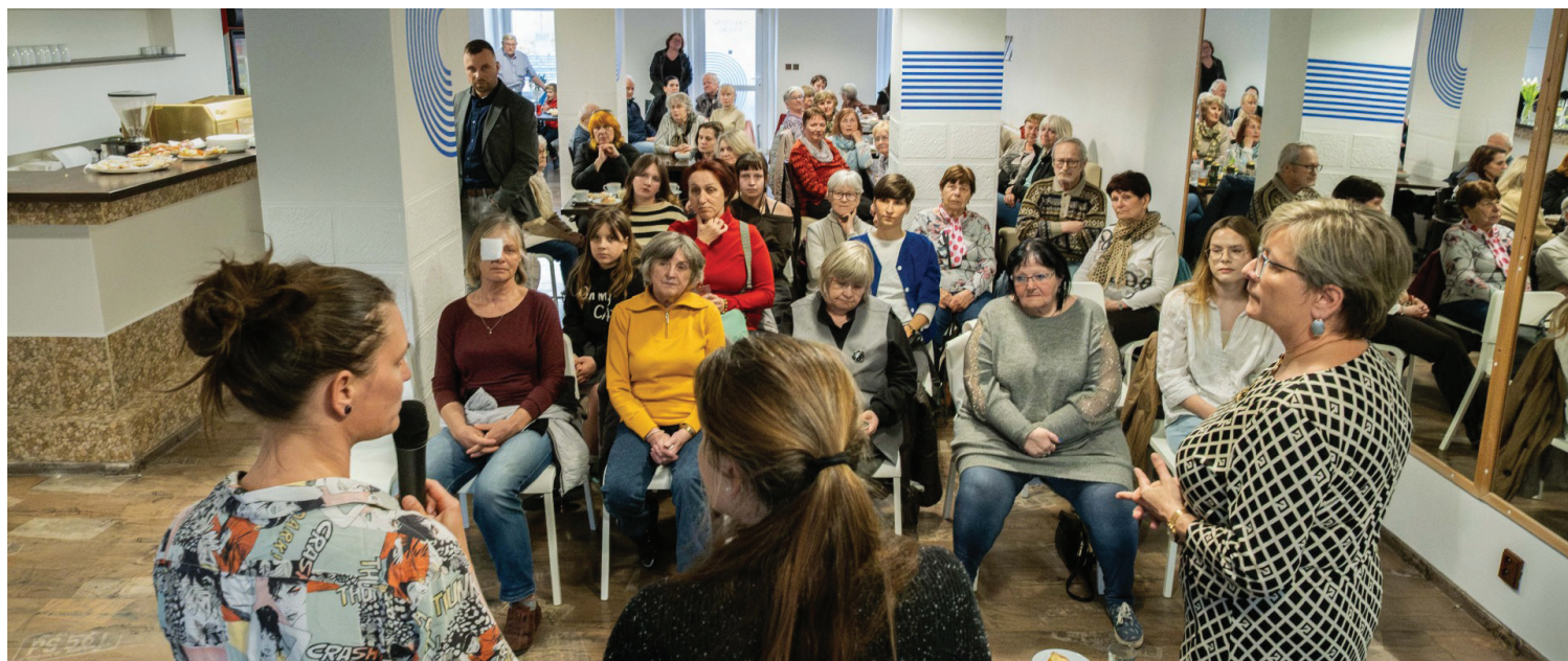
Slavnostní otevření klubu si nenechaly ujít desítky lidí

Varnsdorf ■ Ve čtvrtek 19. března se ve Varnsdorfu otevřel nový komunitní prostor Závodní club. Nápad vytvořit jej nevnikl „shora“, ale přímo z potřeb lidí.