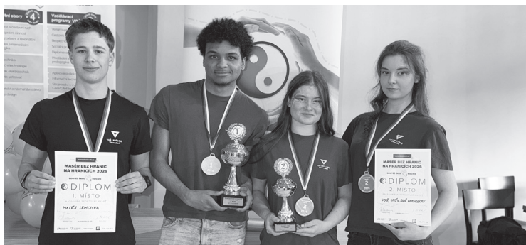
Studenti z Varnsdorfu uspěli v mezinárodní soutěži

Účelem akce je prohloubení odborných znalostí a vzájemná výměna zkušeností žáků oborů „Masér sportovní a rekondiční“ a „Rekondiční a sportovní masér“. Soutěž probíhala ve dvou hlavních kategoriích: Sportovní masáž a Alternativní masáž. Odborná porota, složená ze zástupců jednotlivých škol, hodnotila techniku provedení, celkový dojem, přístup ke klientovi, vystupování a dodržení časového limitu. V kategorii Alternativní masáž na-