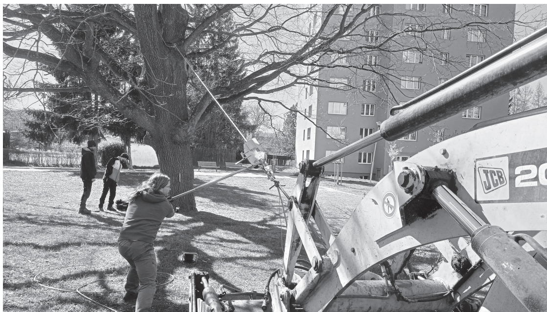
Varnsdorf nechal provést tahovou zkoušku u dvou stromů

Tahová zkouška stromu je přesná přístrojová metoda, která simuluje zatížení větrem a měří reálnou stabilitu stromu proti vyvrácení nebo zlomení tam, kde vizuální hodnocení nestačí. Provádí se u vzrostlých, cenných stromů s podezřením na statickou vadu