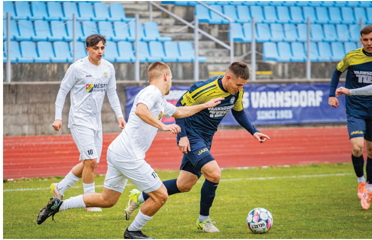
Varnsdorf doma porazil Neratovice

„Pro nás to byl opět důležitý zápas. Dotáhli jsme se na ostatní soupeře. Myslím si, že bylo vidět, že jsme od první minuty chtěli zápas více vyhrát. Apelovali jsme