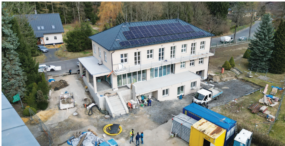
Administrativní budova nemocnice prošla výraznou proměnou

V rámci rekonstrukce dostal objekt nová okna, dveře i střechu včetně instalace fotovoltaických