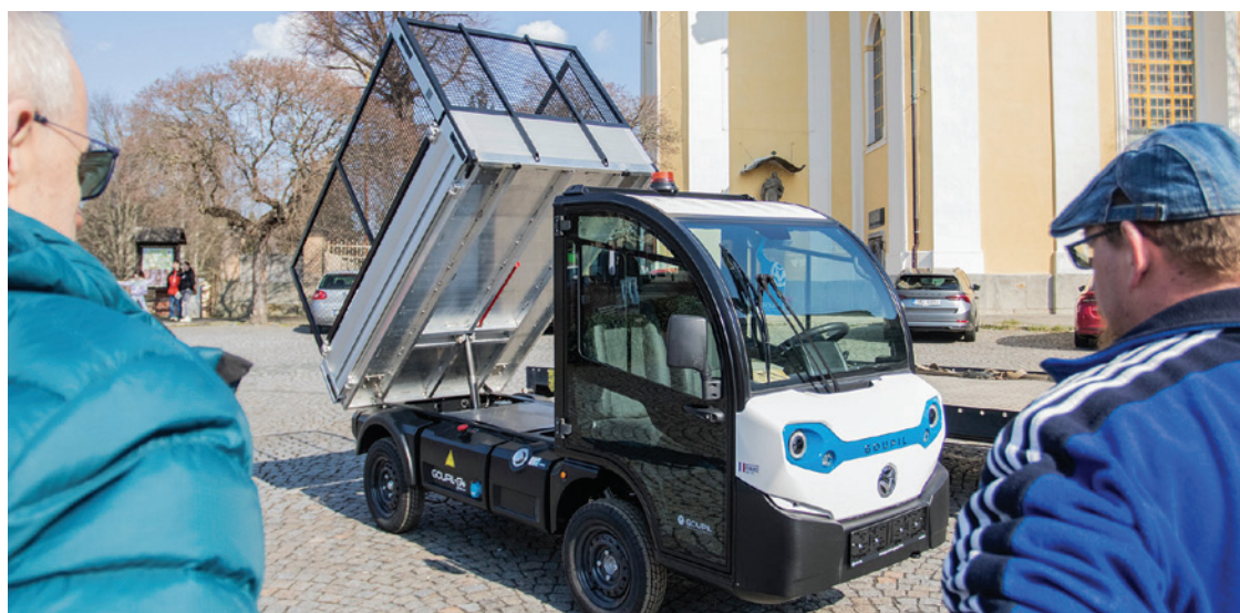
Elektromobil Goupil G4 se sklápěcí plošinou; foto Tomáš Secký

Stejný typ užitkového elektromobilu již využívají také Technické služby města Varnsdorf, a to například při vyvážení odpadkových košů v parcích a dalších veřejných prostranstvích. Na základě dobrých zkušeností s jeho provozem se proto město rozhodlo pořídit