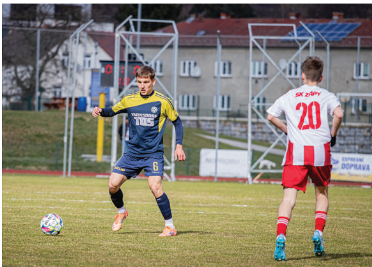
Varnsdorf zaskočil Zápy a před domácím publikem zvítězil 3:0

Svěřenci kouče Pavla Rudnytskyho sehráli možná nejlepší