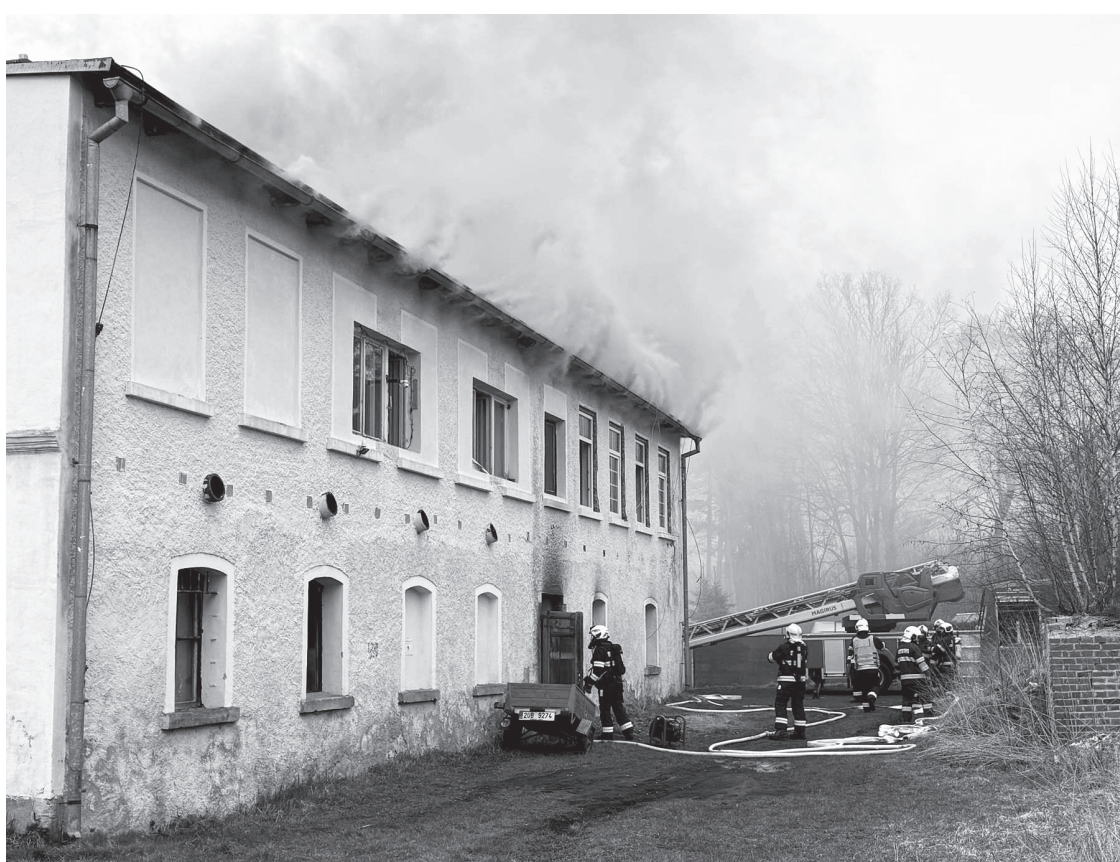
Několik jednotek hasičů muselo likvidovat požár v Měšťanské ulici ve Varnsdorfu

din večer bylo na tísňovou linku oznámeno, že z komínu domu na křižovatce ulic Boženy Němcové a Bjarnata Krawce šlehají plameny.