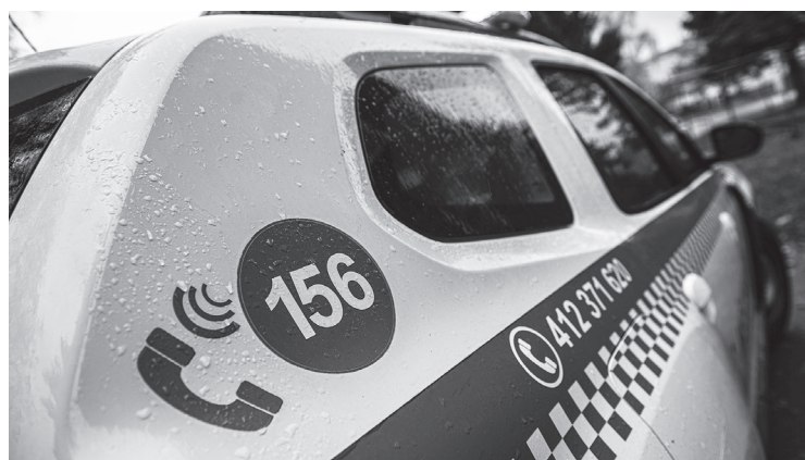
Ilustrační foto MP Varnsdorf; foto miw.cz

Ve večerních hodinách obdržela Městská policie Varnsdorf oznámení od občanky, která si stěžovala na hlasité zvuky z bytu o patro výš. Mělo jít o velmi hlasitou ránu, která v ní vzbudila obavy. Hlídka se spojila s majitelkou bytu, odkud hluk pocházel, která však nechápala důvod jejich přítomnosti. Po vysvětlení situace hlídka zjistila, že je vše v pořádku a místo opustila.