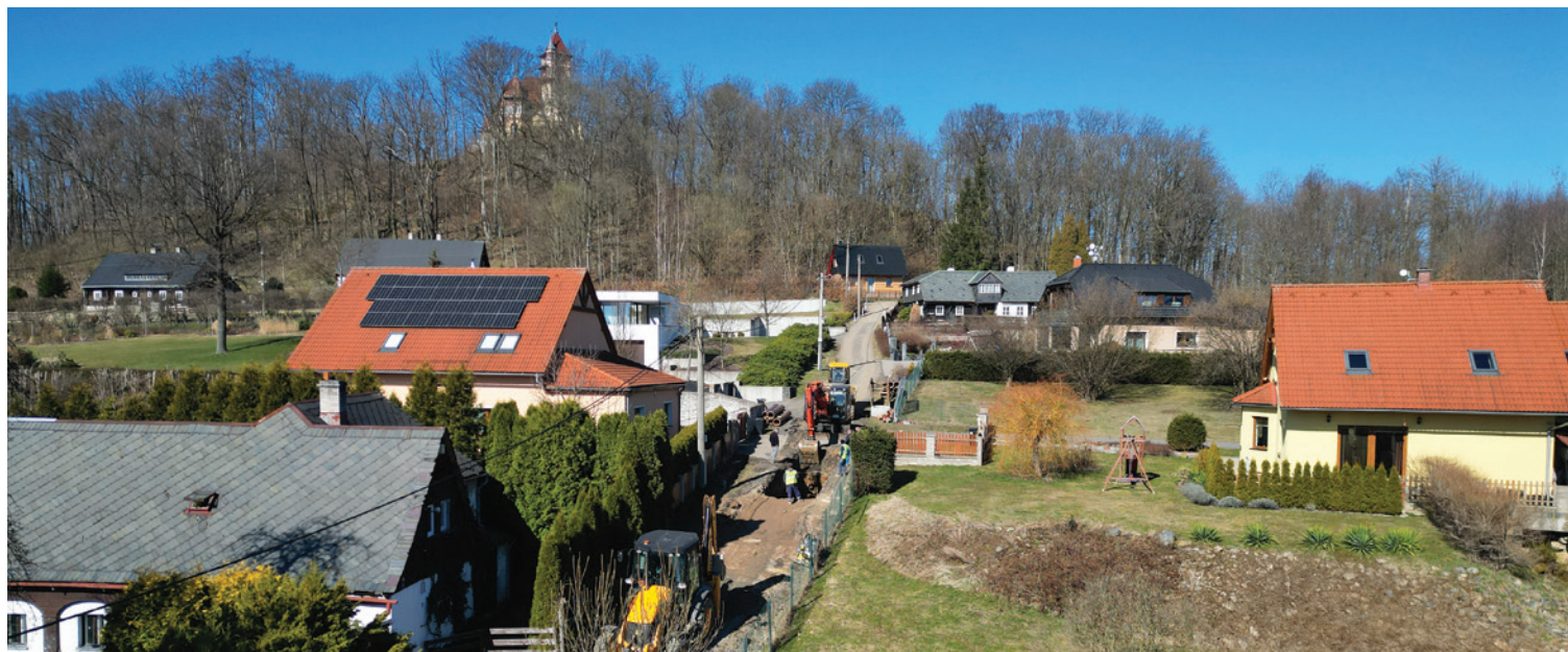
Stavební stroje v Kladenské ulici. Město buduje splaškovou a dešťovou kanalizaci

Varnsdorf ■ Město začalo s realizací další významné investice do infrastruktury v okrajové části města. Rozběhla se výstavba splaškové a dešťové kanalizace v délce téměř dvě stě metrů v Kladenské ulici.