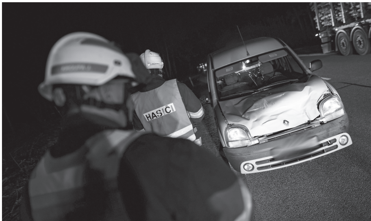
Hasiči řešili během několika dnů dvě nehody s lesní zvěří

Varnsdorf ■ Hned několik dopravních nehod, při kterých figurovala lesní zvěř, řešili na Studánce profesionální hasiči z Varnsdorfu.