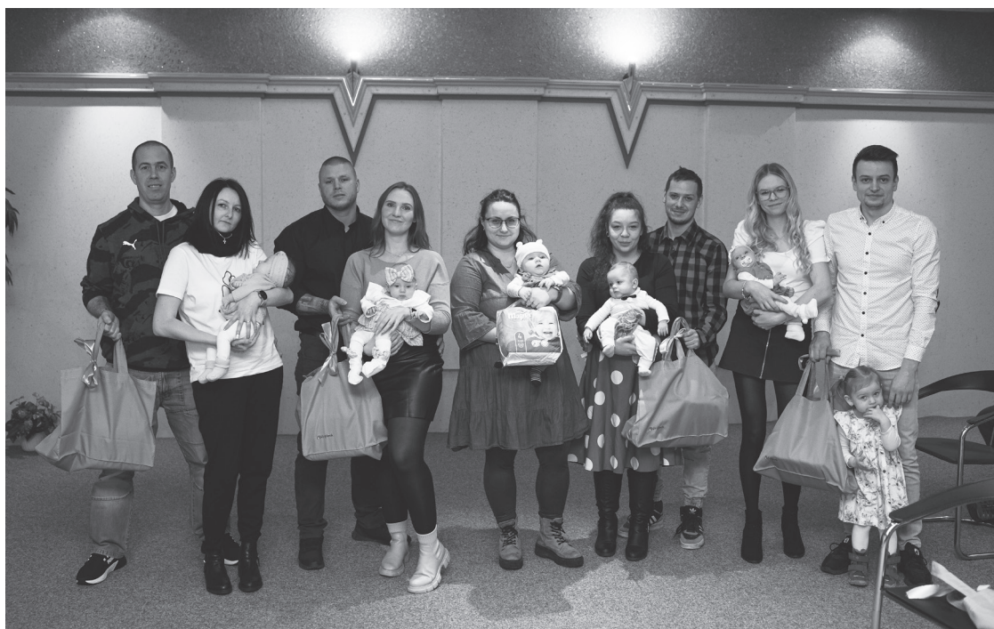
Novopečení rodiče během vítání občánků

Neodmyslitelnou součástí vítání občánků je také symbolické focení, osobní gratulace a několik dárečků. „Každé miminko obdrží pamětní list, poukázku do drogerie a balík plen, které novým členům našeho města daruje společnost Drylock. Moc si této spolupráce, která trvá již několik let, vážíme a oceňují ji i novopečení