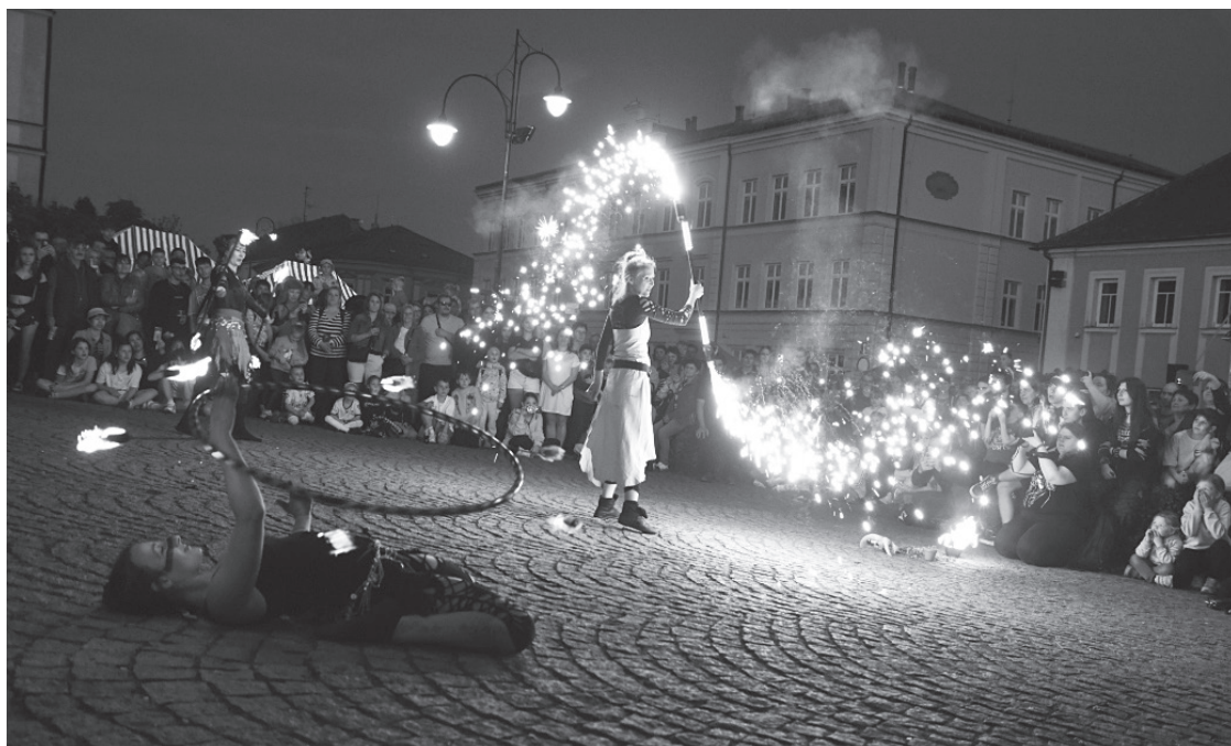
Pálení čarodějnic nabídne bohatý doprovodný program

Tahle pohanská tradice, jako ostatně mnohé jiné, později