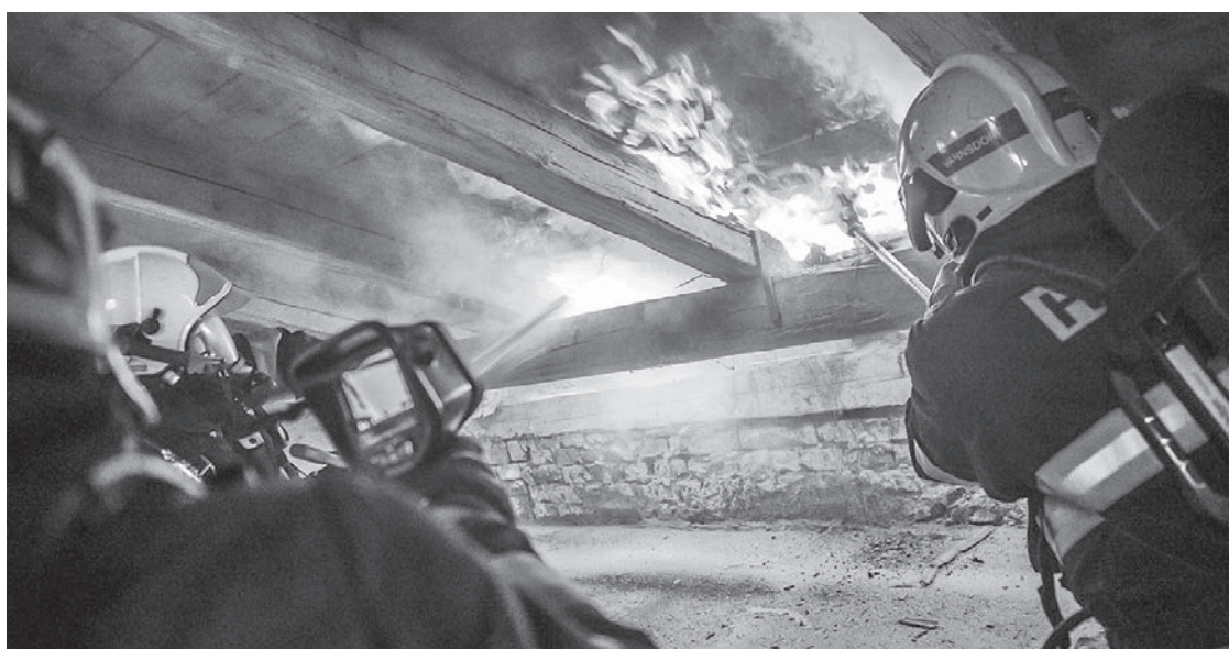
V objektu vlakového nádraží v Krásné Lípě došlo k zahoření střechy

Z Horské ulice ve Varnsdorfu byl v neděli 15. října oznámen požár garáže u domu. Operační středisko vyslalo cisterny profesionálních