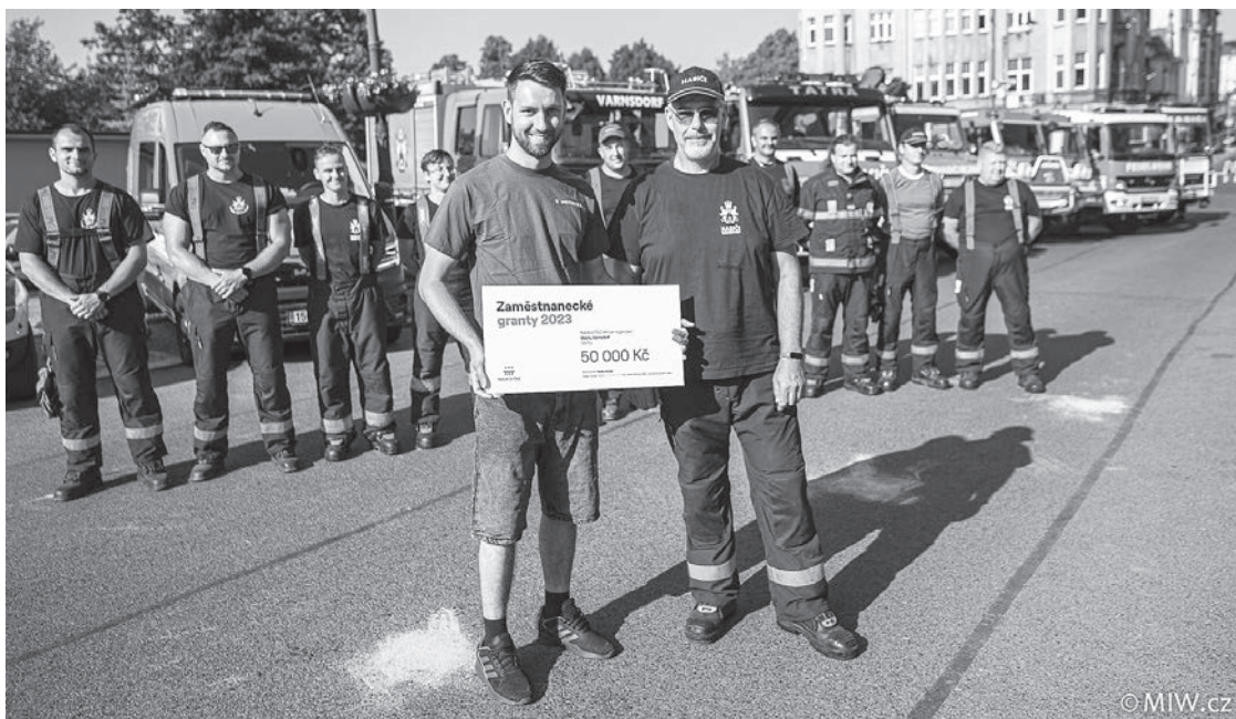
Nadace ČEZ podpořila varnsdorfskou dobrovolnou jednotku částkou 50 tisíc korun

Zakoupena byla také sada pro nouzové otevírání uzavřených prostor od Rescop systému, poslouží hasičům hlavně v době, kdy profesionální jednotka bude mimo město. Poslední položkou byly čtyři kusy u hasičů tak oblíbených magnetických akumu-