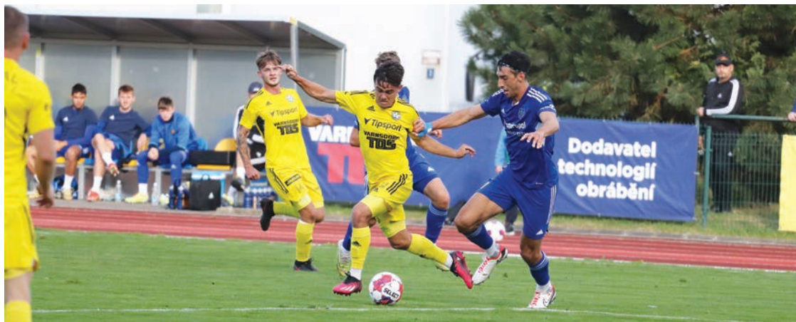
Fotbalisté neuspěli ani proti Jihlavě

„Měli jsme v zápase hrozně výkvy. Začali jsme velmi dobře a já jsem si říkal, že to je konečně ten zápas, kdy to zlomíme. Zaslouženě jsme šli do vedení. Jenže pak to Jihlava bleskově otočila, my jsme