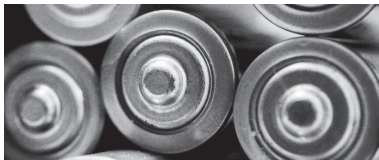
Sběr baterií pokračuje v budově úřadu i nadále; foto Pexels.com

A proč se vůbec baterie třídí? Pokud by baterie skončily v běžné popelnici, putovaly by na skládku