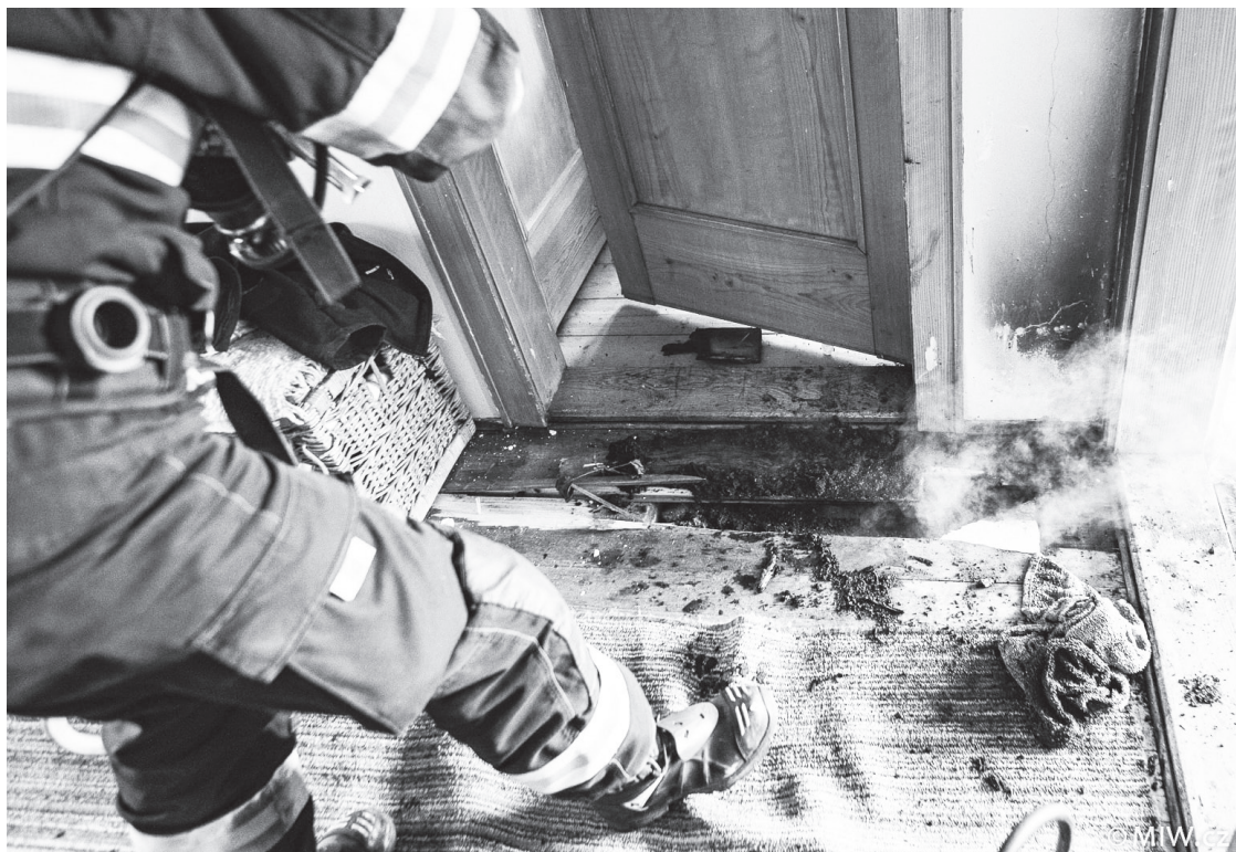
Hasiči vyjžděli do ulice Truhlářská k požáru dřevěného stropu, ten chytil od komína

Je velkým štěstím, že se příznaky požáru objevily ve dne, v noci by byly následky zřejmě horší.