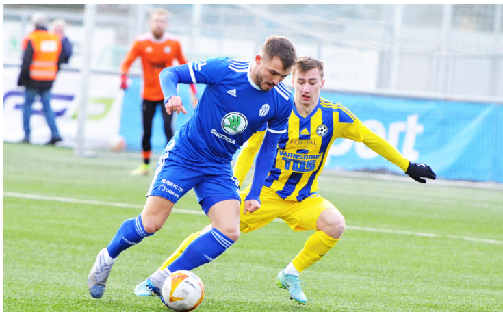
Fotbalistům se v Tipsport lize příliš nedaří