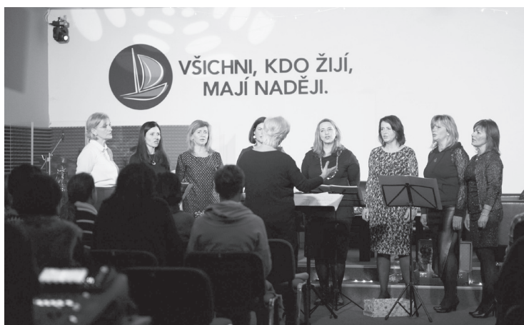
Naposledy proběhl v Hosaně vánoční benefiční koncert Náhodou

Hosana Café a církev Hosana jsou vlastně dva subjekty, které dohromady spolu s dalšími dobrovolníky z Varnsdorfu a přilehlého okolí tvoří společenství, jehož členové nad rámec své běžné práce pořádají různé akce pro veřejnost s charitativním přesahem. Svou činností se snaží místním občanům ukázat, že nejsou uzavřená komunita. „Myšlenka benefičních akcí se nám líbila už dlouho, a když jsme uvažovali nad tím, kam svou pomoc směřovat, volba nakonec padla na nadační fond Nehemia. Líbí se nám jejich projekty, které jsou možná pro někoho kontroverzní, ale my si za touto volbou stojíme a víme, že se vybrané finanční příspěvky opravdu dostávají do oblastí ke konkrétním lidem, kteří jsou na hranici chudoby, nemají dostupnou lékařskou péči a jsou ohroženi