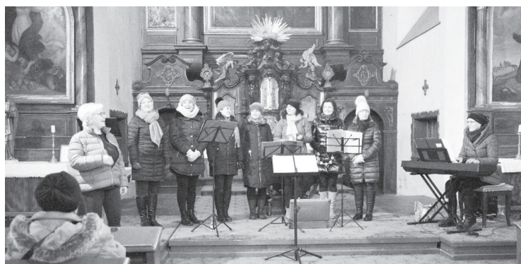
Pěvecké sdružení Náhodou v kostele sv. Vavřínce v Rumburku

„Jsem zastánce názoru, že není důležité, zda člověk umí zpívat. Důležité je to, zda zpívá rád, ze srdce a zpěv ho dělá šťastným. To, že trpí okolí je pak otázka druhá. Určitě budeme za jedno, že varnsdorfské Náhodou zpívá nádherně, ovšem pěvecké schopnosti