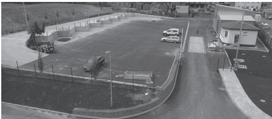
Sběrný dvůr je dokončen, jeho otevření brzdí administrativa; foto Tomáš Secký

Společnost EKO servis Varnsdorf a.s. v současnosti zajišťuje zpracování nového provozního řádu a zajištění všech potřebných podkladů pro co nejrychlejší vydání souhlasu k provozování nového sběrného dvora. „Nejpozději do konce ledna bude nově zpracovaný provozní řád sběrného dvora odevzdán ke schválení na Krajskou hygienickou stanici Ústeckého kraje a následně na Krajský úřad Ústeckého kraje. Jakmile souhlas k provozování nabude právní moci, je teprve možné