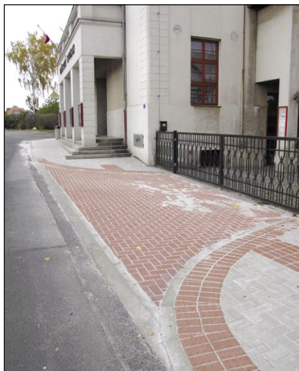
U divadla vznikl nový chodník. Součástí úpravy bylo i přeložení schodiště.