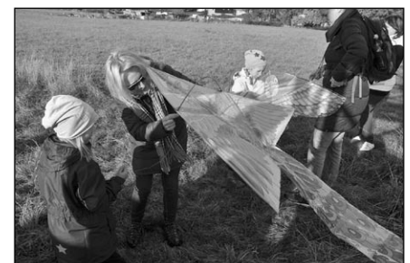
Dům dětí a mládeže a středisko Lužan pořádaly na Špičáku Skautskou drakiádu.