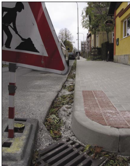
Ve Východní ulici má opravený chodník i s obrubami.

Za pozornost stojí také začínající celková rekonstrukce veřejného osvětlení, kterou budou provádět technické služby. V současné době je rozhodnuto o výběru typu stožárů. První dokončené můžete vidět v Barviřské ulici. V těchto dnech se ještě vybírá model vrchní lampy. Město se rozhoduje mezi šesti možností. Všechny uvažované typy lamp jsou vystaveny v Husově ulici, kde si je můžete prohlédnout v akci. V každém případě půjde o úsporné LED-diodové osvětlení.