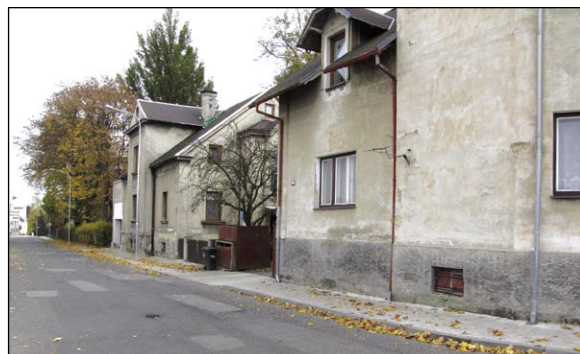
V ulicích Partyzánů a Tyršova je nejen opravený chodník, ale i nové stožáry veřejného osvětlení.