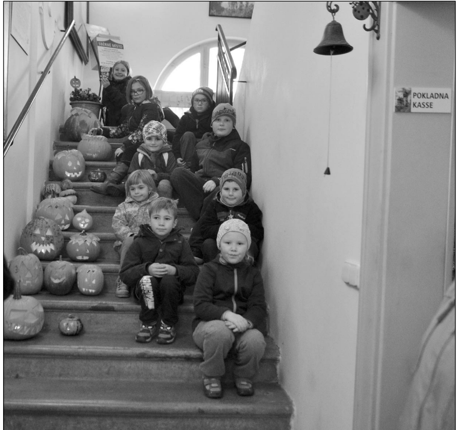
Na Hrádku děti vyřezávaly a rozsvěcely dýně.