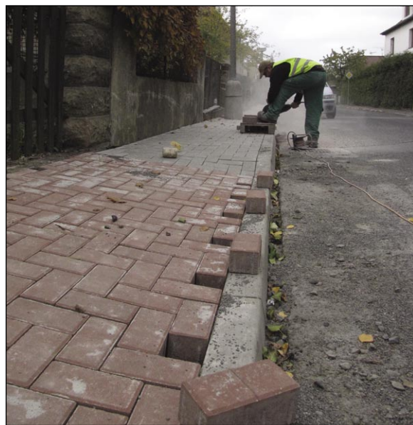
Před dokončením je oprava chodníku v Kostelní ulici.

PEKAŘSTVÍ LIMMA, Varnsdorf, Pražská 2952 Otevírací doba: Po – Pá: 5:00 – 17.00 hod, So: 6:00 – 11.00 hod www.pekarstvilimma.cz www.facebook.com/PekarstviLimma