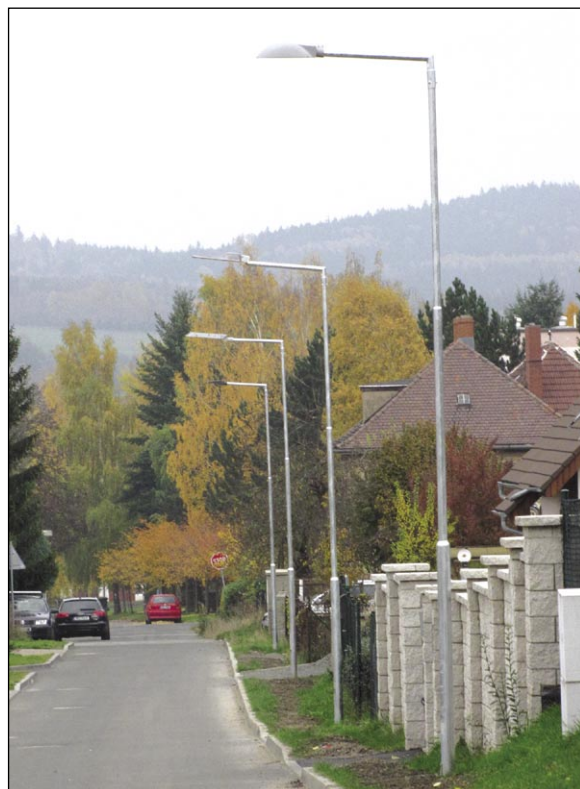
V Husově ulici si můžete prohlédnout uvažované typy veřejného osvětlení.