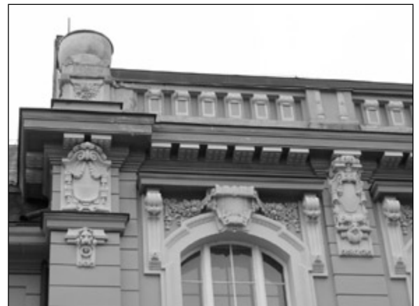
Fasáda č. p. 1804 je vsutku reprezentativní, snad až přezdobenou vizitkou bankovního ústavu - dnes zde sídlí Speciální ZŠ a MŠ.

Bylo sice nevidno, ale poměrně početné skupině zájemců se procházka s deštníky vyplatila. Prošli vlastně jen několik ulic v centru, počínaje blokem domů v ul. Legii a konče budovou České pošty a „Sloupákem“ na ul. Poštovní. Objevili pohledné fasády a zajímavé detaily, jichž si při všednodenních pochůzkách sotva po-