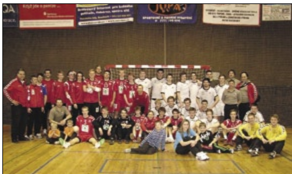
Obě reprezentace po utkání - vlevo v červeném Norové, vpravo v bílém reprezentanti ČR.