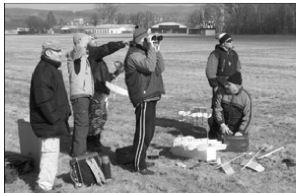
Kam házedlo odletělo? Po 6 minutách sledování zmizelo to Štohanzlovo v městské zástavbě.