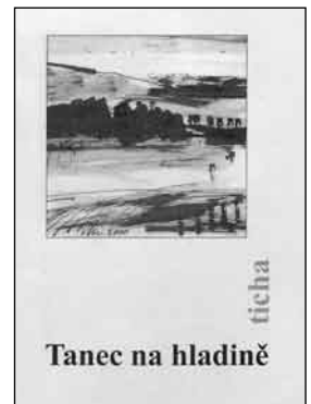
Tanec na hladině

Malíř, grafik, ilustrátor. Narodil se na Slovensku, vyrůstal v jižních Čechách. Absolvoval Vyšší průmyslovou školu sklářskou v Železném Brodě u profesorů Jaroslava Brychty a Stanislava Libenského. Třicet let působil jako propagační výtvarník a litograf ve Varnsdorfu. Zde byl mj. spoluzakladatelem a aktivním členem skupiny výtvarníků Kontrast, která se výrazně podílela na kulturním dění ve městě v 60. letech. Později - až do konce života - žil a pracoval v Praze jako propagační výtvarník a umělecký malíř. Podle jeho návrhů byly např. realizovány barevné reklamy na tramvaje a jiné veřejné objekty. Ve volné umělecké tvorbě se věnoval grafice, olejomalbě a lavírované kresbě tuší vytvářené brkem nebo bambusovým dřívkem. K vrcholům jeho tvorby patří pětice prací Objekty '93 (mj. Pocta Jakubu Krčínovi z Jelčan, Konec federace, Vesmír) a cyklus krajin z roku 2000. Zúčastnil se řady společných výstav, uspořádal několik výstav samostatných, mj. v Praze a Varnsdorfu, kde se po více než čtvrtstoleté odmlce v r. 2001 prezentoval novými obrazy nadšeně přijatými