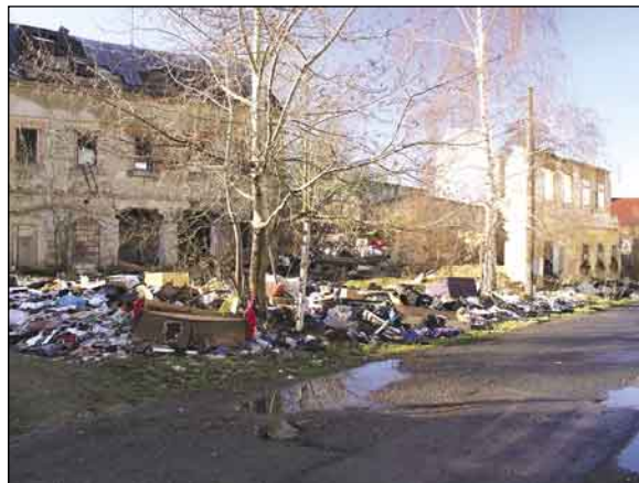
Horní nábreží trápí všechny obyvatele (více str. 3).