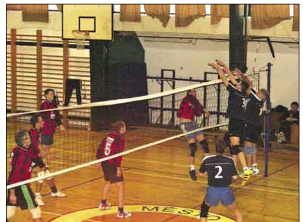
Volejbalisté Slovanu (červeně-černé dresy) v derby proti Rumburku neuspěli a odešli dvakrát poraženi.