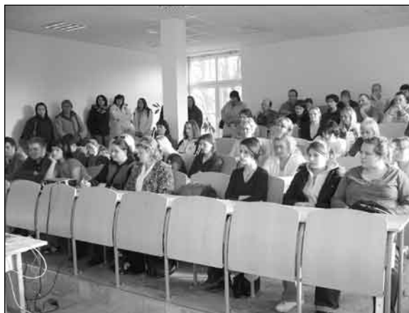
Studenti školy v posluchárně Vzdělávacího střediska.

Šluknovský výběžek dlouhodobě trpí absencí možnosti vysokoškolského studia pro absolventy středních škol, ale i pro občany, kteří již pracují a chtějí získat vysokoškolskou kvalifikaci. Proto je náš výběžek jedním z regionů ČR, kde je nízké procento vysokoškolsky vzdělaných občanů. Situaci zhoršuje také skutečnost, že velká část mladých lidí, kteří odcházejí studovat na vysoké školy mimo region, se již nevrací. Střední škola služeb a cestovního ruchu Varnsdorf proto již delší dobu vede jednání s vysokými školami o spolupráci a možnosti otevřít v prostorách SŠS a CR odloučená pracoviště. V závěru minulého roku byla tato dohoda uzavřena.