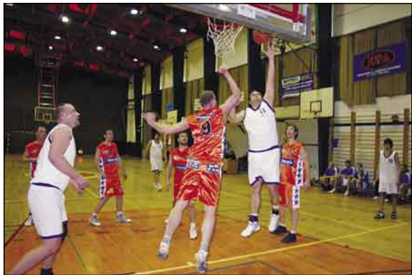
Muži si v letošní sezoně nevedou špatně a usilují o postup. Snímek je z utkání s Roudnicí A (87:67).