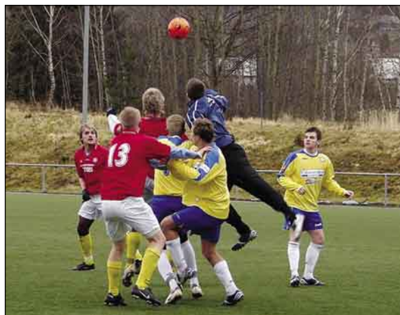
Fotbalová příprava na jarní odvetu je v plném proudu. Snímek zachycuje odvracení rohu Slovanu hráči a brankářem béčka Teplic.

ho turnaje jej porazil první mančaft ústeckého krajského přeboru Vilémov 1:6 (0:2), branku vstřelil v 55. min. Pácha. Mladší dorost měl za soupeře rovněž mužský celek - Jiříkov, se kterým odešel poražen 1:5 (0:3), jediný