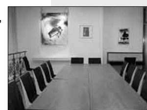
(Společenská a konferenční místnost)

Za několik dnů uplyne šest let (2. 3. 2002) od slavnostního otevření Domu služeb ATRIUM, který vzniknul po náročné rekonstrukci bývalého internátu Spojů. Před dvěma lety se majitel rozhodl k další investici - a to k přeměně objektu na hotel. Cílem bylo vybudovat ve Varnsdorfu hotel běžných evropských standardů pro mezinárodní klientelu. Dříve návštěvníci po příjezdu do našeho města museli hledat ubytování často až v Novém Boru, Liberci nebo německém Zittau. Po téměř ročním úsilí bylo koncem roku 2007 dílo dokončeno. Ke spokojenosti mnoha obchodních partnerů, místních i okolních firem, ale i turistů zde vzniklo moderní ubytovací zařízení včetně služeb a hotelové restaurace.