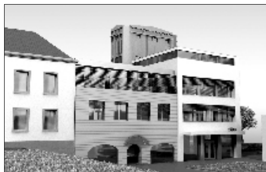
Vizualizace úpravy vodárenské věže.

V návaznosti na stavbu marketu Hypernova zadala radnice k vypracování urbanistickou studii okolí věžičky s vazbami na celý prostor ohraničený náměstím - Poštovní ulicí - Otáhalovou - Národní - včetně parku. Svoji studii opravy továrního objektu Otáhalova 3269 (věž) si zadali i manželé Čelkovi. Vypracovaná vize, kterou radnice řeší i v součinnosti se zmiňovaným soukromým investorem, je s maximálním otevřením prostoru pro obyvatele.