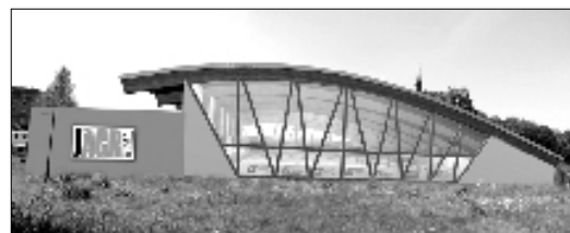
Zimní stadion, jako multifunkční hala.