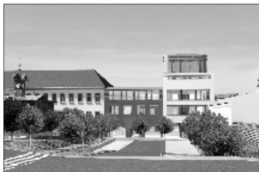
Pohled na parkoviště.

Právě tyto prostory jsou totiž vnímány jako přirozený střed města, ve kterém je soustředěn nákupní a veřejný život a který je zapotřebí těmto skutečnostem přizpůsobit. Součástí studie je jak úprava stávajícího dopravního řešení, vybudování přechodů a chodníků, ale zejména komplexní propojení nákupní části s částí kulturní a odpočinkovou. Kromě již zmíněných komerčních záměrů studie zapadá i do kontextu řešení parkových a relaxačních úprav okolí budoucího multifunkčního kulturního zařízení.