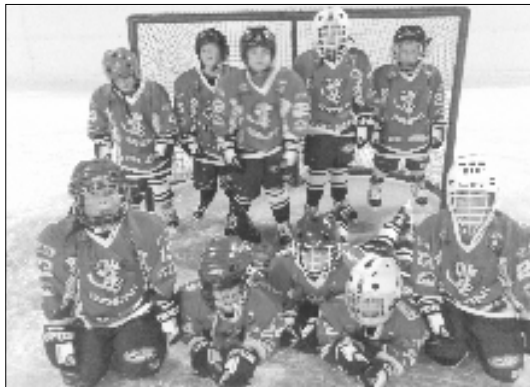
Na snímku nejmenší varnsdorfské hokejové naděje.

V neděli 10. září odjely týmy našeho hokejového klubu trénovat do Děčína. Místní HC nám umožnil využití dvou hodin ledové plochy za hostování našich dorostenců v jejich družstvu. Tuto dobu jsme plně využili k trénování od přípravky až po muže. Některé malé děti byly vůbec poprvé oblečeny do kompletní hokejové výstroje, a tak se cítily jako opravdoví hokejisté. Ještě jim to příliš nejde, ale družstvo těch nejmenších se snaží a od listopadu by mělo hrát soutěž elévů v minihokeji. Druhé družstvo hraje minihokej 3. tříd a na našem stadionu by se měli ukázat i muži. Družstvo starších žáků je zařazeno do Královohradeckého kraje za HC Jičín, protože v našem kraji pro ně není vypsaná soutěž. Všichni se těšíme na vaši návštěvu hokejového stadionu a na mohutné povzbuzování.