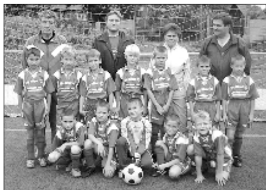
Mladší příprava SK Slovan Varnsdorf.

Ženy cestovaly do Staré Lysé u Benátek nad Jizerou a prohrály tam 5:2 (3:1). Zá-