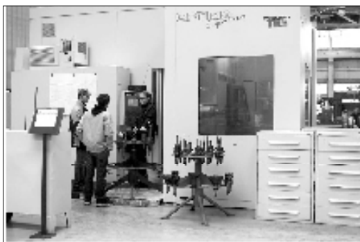
Obráběcí stroje historické (vlevo nahoře) a obráběcí stroje dnešní (upravo dole).