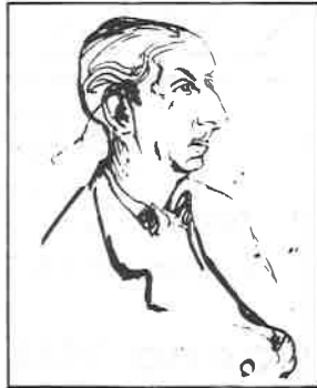
Spisovatel Max Brod, ?, kresba rákosovým (?) perem a tuší