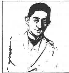
Podobizna člověka, ?, kresba tuší

...1937? 1936? Profesor Vilém Nowak na pražské Akademii výtvarných umění přijal Petra do ateliéru své školy. Byl to velice tolerantní a pokroko otevřený