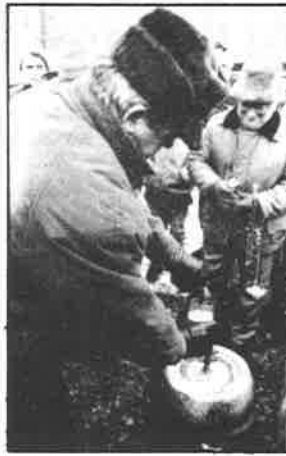
Takto se čepovalo starostenské pivo.

- Městské policii za organizační výpomoc, které se zhostili stejně dobře jako při Silvestrovském běhu,