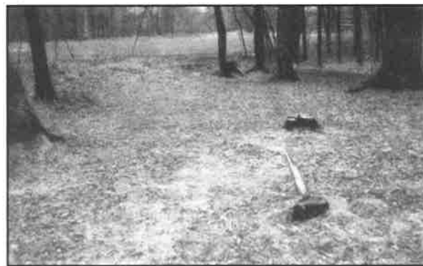
Uložené stromy u hřiště za nemocnicí (fotodokumentace odboru ZP MěÚ). O kácení stromů v našem městě píšeme na 3. straně.