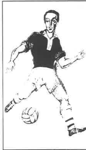
Dobová fotografie z kroniky fotbalistů

Nejlepší výrobky postoupí do finále, kde odborná porota určí vítěze. Zdařilé práce