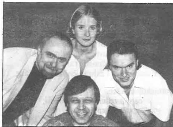
Poetické Studio Doteky