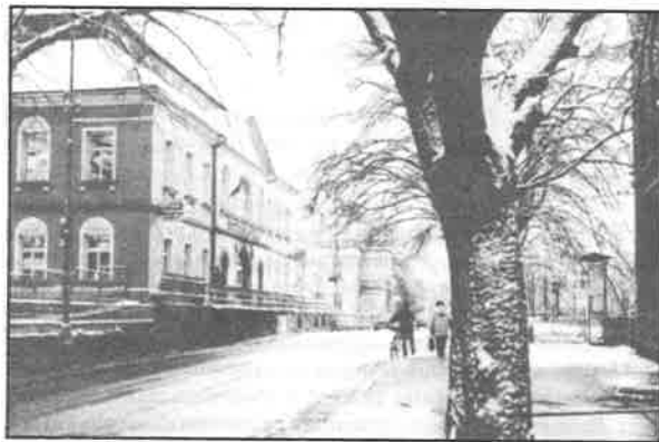
Na rozloučenou se zimou.

Upozornění: Pro zájemce o zápisní děti do 5. mateřské školy, Městská ul. 124 se zápis uskuteční v 17. mateřské škole, Pražská ul. 2812.