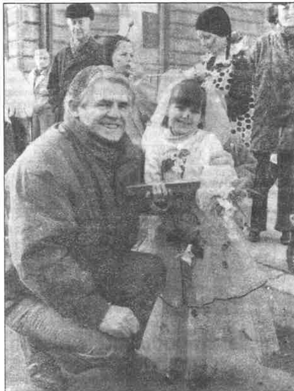
„Vila květinka“ se starostou, který o masopustu odložil na chvíli starosti.