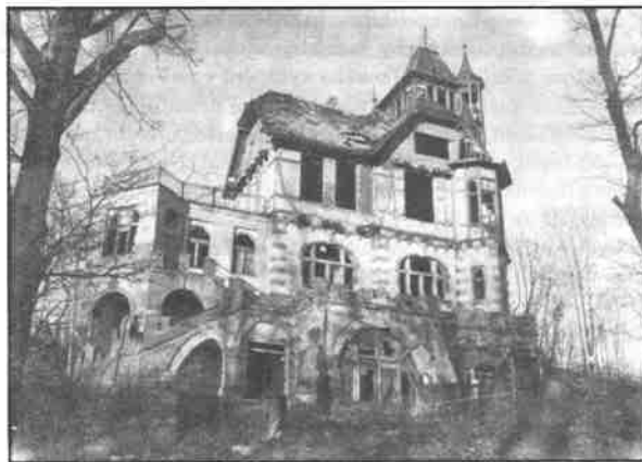
Smutný pohled skýtá výletní restaurace Hrádek. O něm i o jiných ruinách našeho města čtěte dnešního vydání.