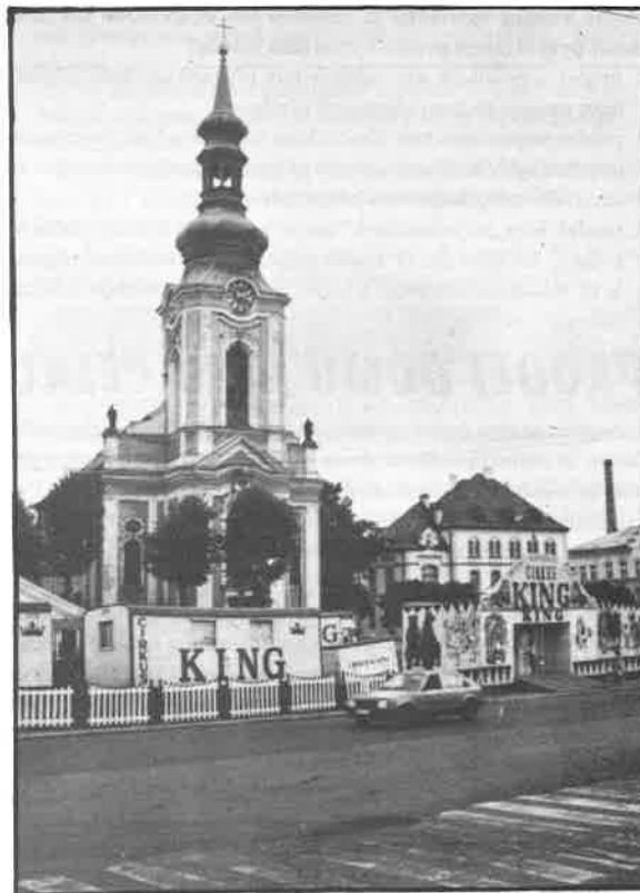
Po několikaleté přestávce bylo naše město opět několik dní ve znamení tradiční cirkusové podívané. Nejprve na hřišti Základní školy na Střelecké hostovali dědicové tradice slavného českého cirkusu Kludský, několik týdnů poté své šapitó rozbili přímo na náměstí vartní umělci a akrobati cirkusu King, který se hlásí k tradici knižně i filmově proslulého Humberta. Snímek R. Petráška zachycuje naše náměstí s dosud neobvyklým koloritem. mhra