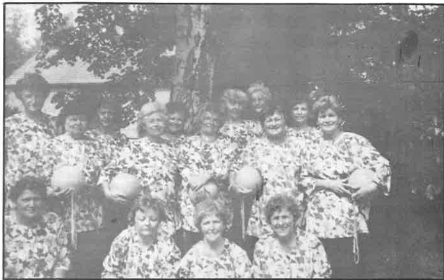
Seniorky Varnsdorfu po vystoupení v SRN

INZERCE V HLASU SEVERU - ÚČINNÁ PROPAGACE VAŠÍ FIRMY PŘIJĎTE SE PORADIT. RÁDI VÁM VYHOVÍME!