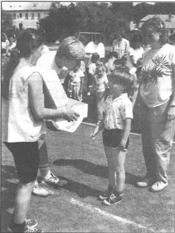
Atmosféru olympiády přibližuje snímek Radka Petráška.