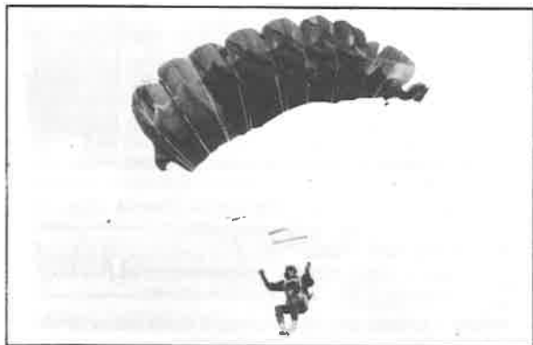
Pohledy prvních návštěvníků dětského dne směřovaly vzhůru k nebi. O zajímavý úvod se postarali parašutisté.

První červnová neděle: nebeský reflektor rozjásal varnsdorfské údolíčko. Na hřišti vedle Sportovní haly je už od rána živo. Organizátoři jedné z největších tradičních akcí pro děti si přivstali a ti nejdůležitější - děti, už také nemohly dospát. Krátce po deváté hodině zavládlo na trávníku vzrušení - nad hlavami zakroužilo sportovní letadlo a ke středu dění zamířily obláčky s parašutisty. Takže to letos konečně sponzorům přiběhlo a dostalo na sto procent. Atraktivním způsobem odstartovalo dopoledne určené dětem a samozřejmě i jejich rodičům.