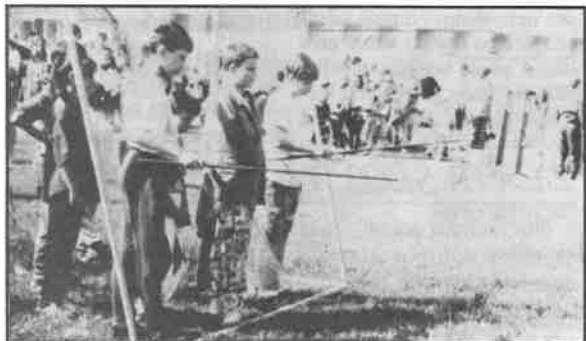
Že nejde chytat ryby na suchu? Náš snímek vás přesvědčí o opaku.

A to už je opravdu všechno - ještě si můžete prohlédnout fotoreportáž Radka Petráška a přístě neváhat a přijít taky. MILAN HRABAL