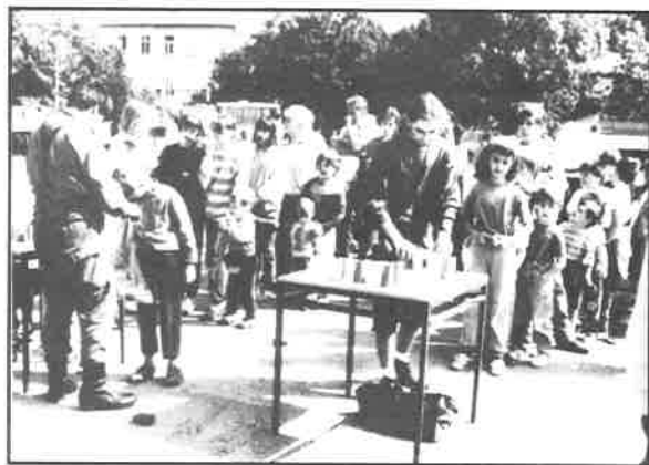
Velký zájem byl i o soutěže zručnosti. Fronty u jednotlivých atrakcí jsou toho přesvědčivým důkazem.

Nestihl jsem vystoupení tanečnicků kroužku Pavla Kubáta (z DDM) ani partu Jaromí-