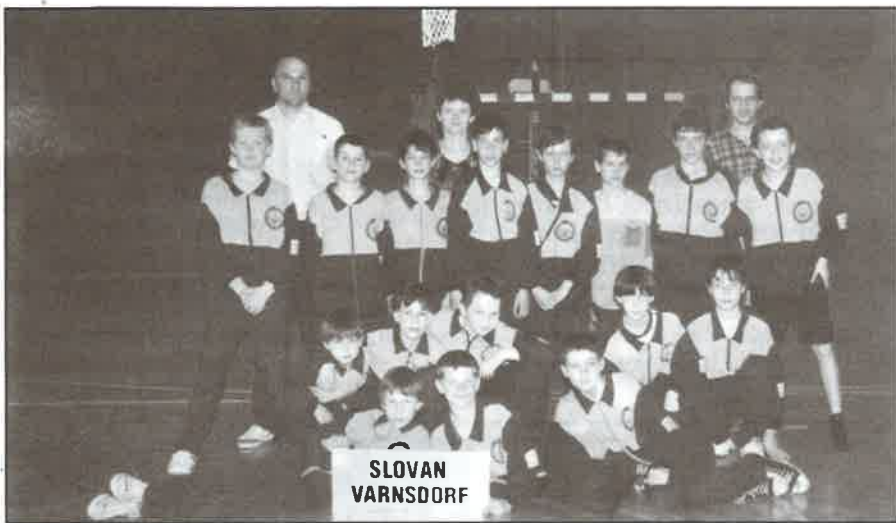
Družstvo našich mladších minizáků, které získalo v Národním finále v mladších minizáčkách ve Varnsdorfu 2. místo a ve stejném složení mezi staršími minizáčkami v Ostrově místo 6.