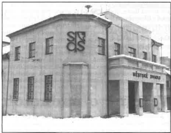
Městské divadlo ve Varnsdorfu slaví v tomto roce čtyřicet let činnosti.