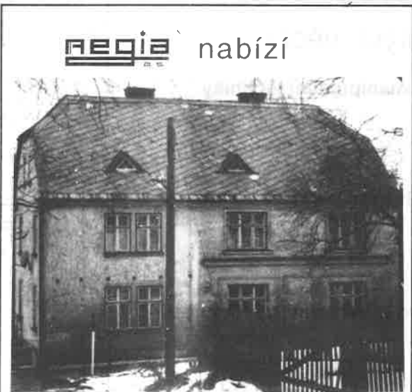
Obytný dum s nebytovými prostorami v Krásné Lípě na příjezdové cestě do Kyjovského údolí. V objektu zahájena rekonstrukce na restaurační a ubytovací zařízení. Zastavěná plocha 154 m 2 - přílehlý pozemek 545 m 2 . Kupní cena 3 000 000 Kč.

OTEVŘENO PO - PÁ OD 10.00 DO 17.00 HODIN