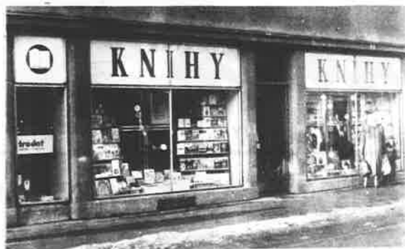
Pohled na prodejnu knih pana Kalivody z Fotostudia Heczeko, o němž zveřejníme další informace v příštím čísle.