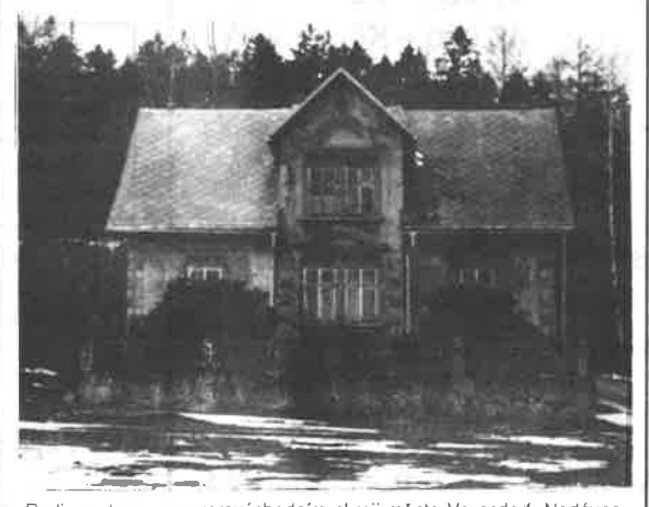
Rodinný dum na severovýchodním okraji města Varnsdorf. Nedávno provedena rekonstrukce celé střechy. Zastavěná plocha 473 m 2 - příl. pozemky 5213 m 2 . Možnost následného odkoupení nových oken na celý dum. Předběžná cena 1 200 000 Kč. Blíže informace na adrese: REGIA, a. s., Kmochova 2136, Varnsdorf, 407 47, telefon 0413/61 590.