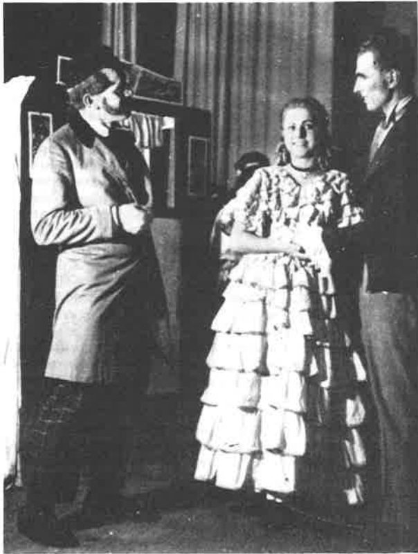
Ze hry Fidlovačka , hrané v roce 1951