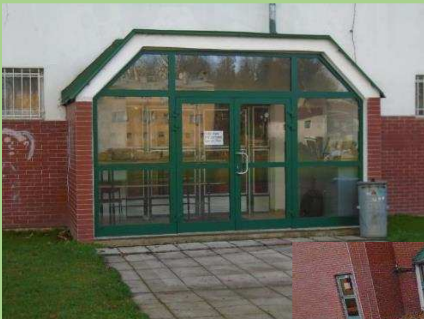
Rekonstrukce vstupu: Samat, s. r. o., Jiřetín pod Jedlovou Cena díla: 89.981 Kč vč. DPH