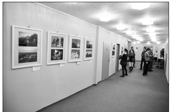
Fotografie Karla Hofmana Výstava ve foyeru divadla