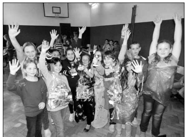
MY FACE 2015 Podmořská říše v ZŠ náměstí E. Beneše