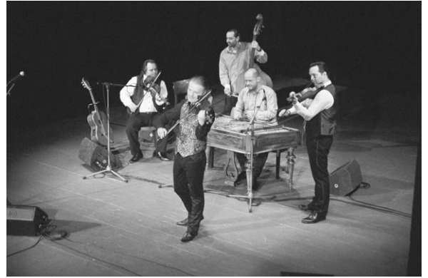
Pavel Šporcl v divadle Houslový virtuos a Gipsy Way Ensemble