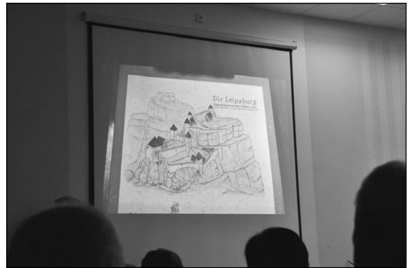
Bybin aneb putování po stopách Karla IV. Beseda v knihovně

Další fáze říká, že na městském úřadě začalo hromadné propouštění. Ta vlastně vznikla bezprostředně po volbách a je takovým stálým evergreenem, který se opakuje po každých volbách. Každá nová garnitura hledá úspory a ty první se vždy hledají v domácím prostředí, tedy na úřadě. Ani letos tomu nebylo jinak, a tak se v březnu skutečně snížil počet zaměstnanců, a to z původních 89 na 85. Další větší změny se zatím neplánují, i když úspory se hledají stále. js