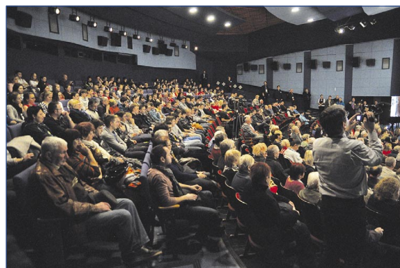
Sál Panoramy během besedy s Milošem Zemanem