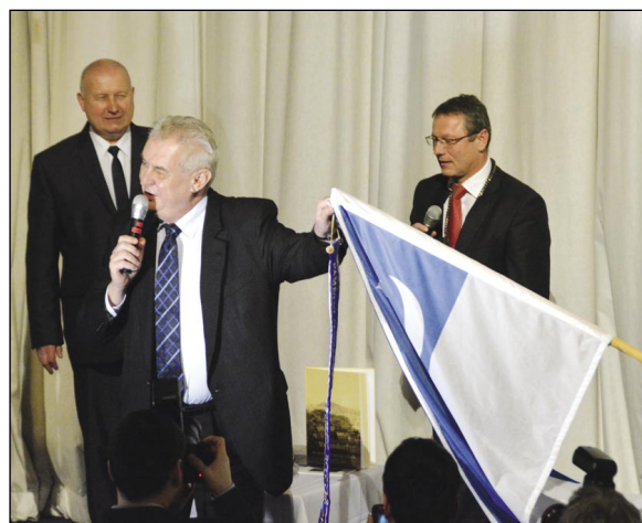
Na závěr besedy v kinosále Panorama prezident zavěšuje na vlajku města pamětní stuhu.