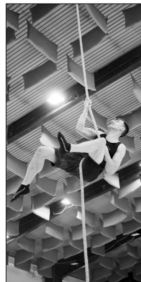
Jeden ze startujících mužů při šplhu na osmi metrech

TOS Varnsdorf, Jan Jarý, T-mapy, Pivovar Kocour, Safety Master, České Švýcarsko o.p.s., R. Kuranda - zámečnictví a elektromontáže a Varnsdorfské uzeniny) za podporu.