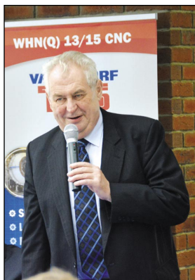
Proslov k zaměstnancům TOSu