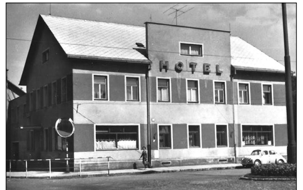
Dobová fotografie hotelu Sport ze 60 let