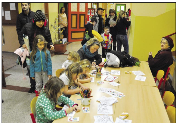
Zápisové momentky z Interaktivní ZŠ Karlova (nahore) a ZŠ náměstí E. Beneše