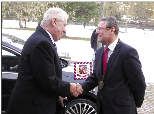
Uvitání prezidenta starostou města před kinem Panorama