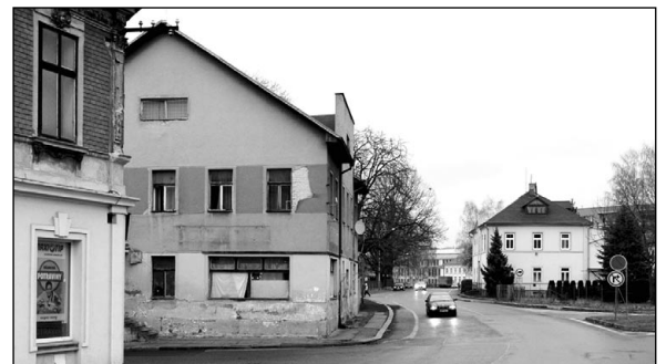
Současnému „hotelu Sport“ tak říkáme už jen ze setrvačnosti.