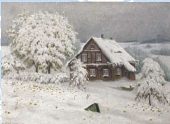
Chýška v zimě (August Frind)