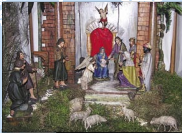
Rumburský Liebschmannův betlém

k mřížím. Knaut si mnul ruce, že jeho chvíle se blíží, a pro jistotu dal strážníkovi láhev kořalky, kterou ovšem předtím otrávil. Když strážník klesl omámený k zemi, vzal mu klíč od Moniččiny kobky, zavázal divce ústa, aby nemohla křičet, a naložil ji ve spěchu na svého koně. Už bylo po poledni, mrzlo, ale sníh pořád nikde. Chudák kůň musel v tom hrozném nečase až do pozdního večera nést na sobě tlustého Knauta a svázanou Moniku přes Staré Křečany, Krásnou Lípu a Jiřetín až na hrad Tolštejn.