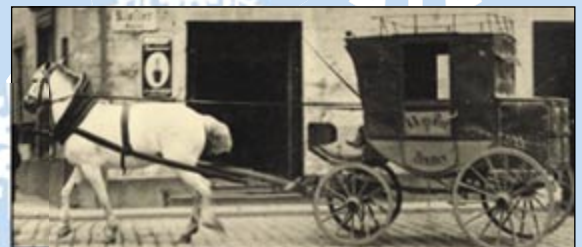
Postilion pana Krause

Polapení Knauta si dodnes připomínají mladí lidé ve Šluknově oblíbeným Honem na divokého muže.